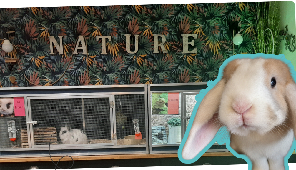
Salle NAC (Nouveaux Animaux de Compagnie)